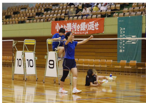
勝利の瞬間(女子団体戦)

広報委員会では高校総体、新人戦の県大会の観戦記を書いてくださる高校生を募集しています。我こそは、と思う高校生諸君は、顧問の先生を通じて、広報委員会までご連絡ください。連絡先は本誌最終ページにあります。