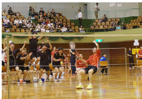
優勝に沸く岡崎城西(男子団体戦)