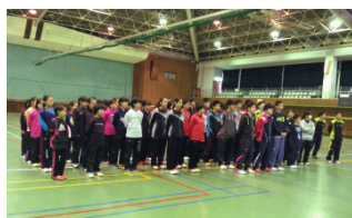
練習を終えて集合写真