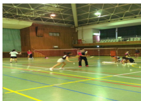
スピードノック練習