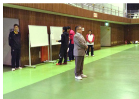
山田理事長より激励