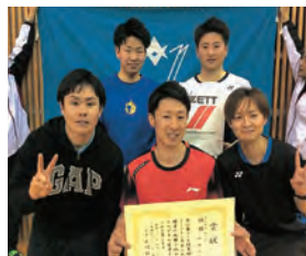
男子1部 優勝 中島会(A)