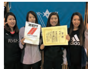
女子1部 優勝 team VOLT